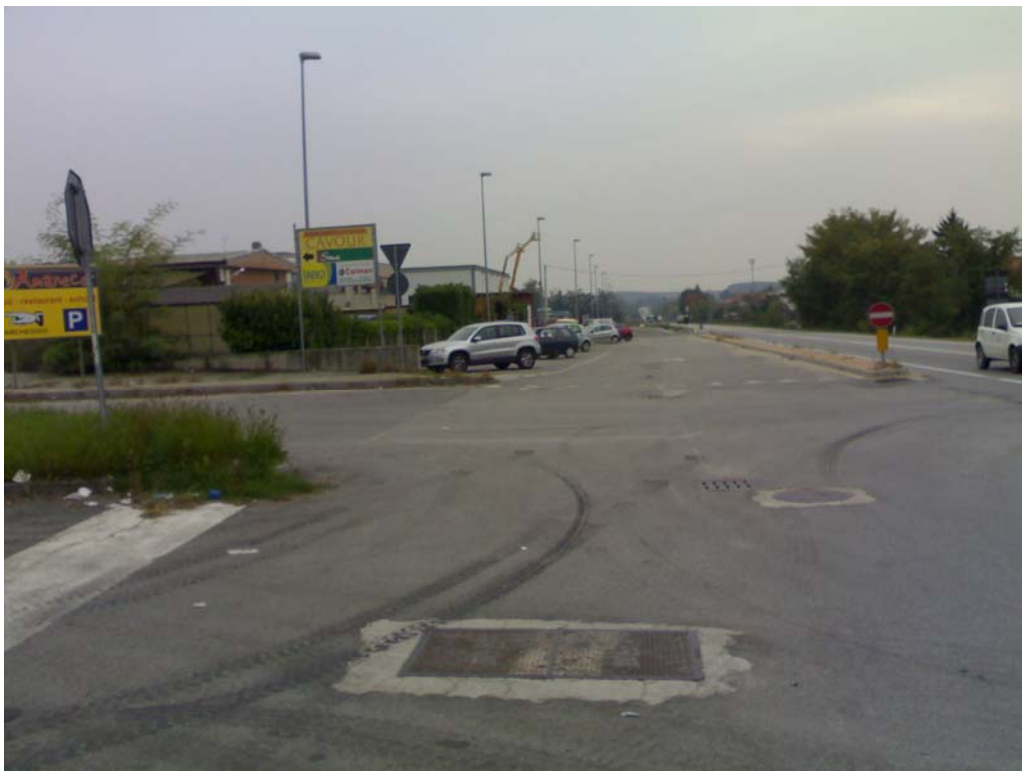
Foto n.1 Incrocio con pozzetto fognatura esistente