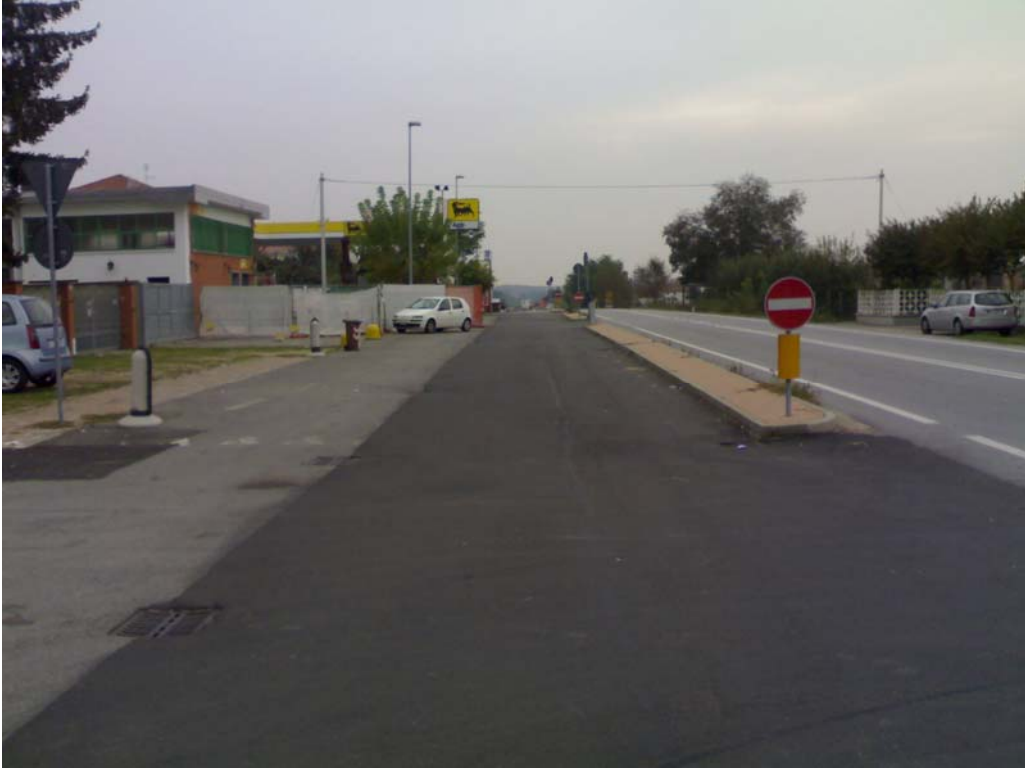
Foto n.3 Via Circonvallazione tratto a monte