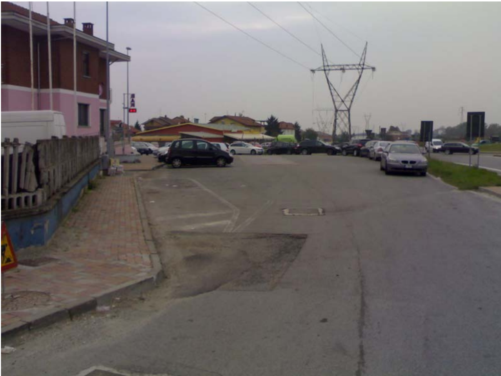
Foto n.4 Via Circonvallazione vista da P10