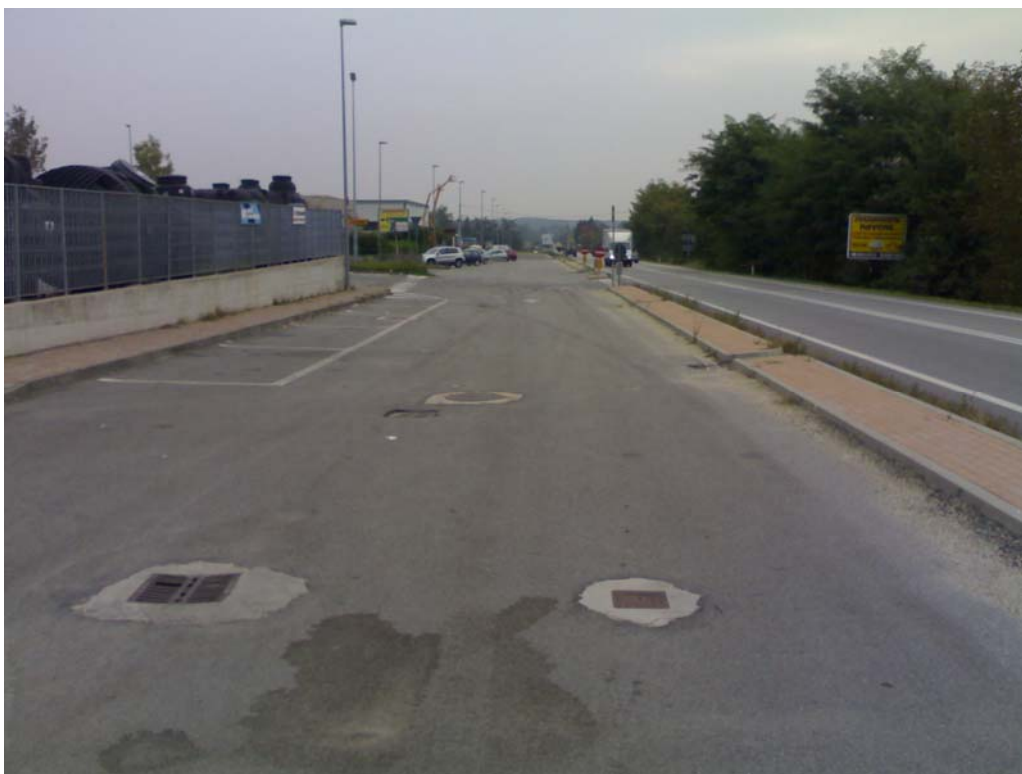
Foto n.2 Via Circonvallazione