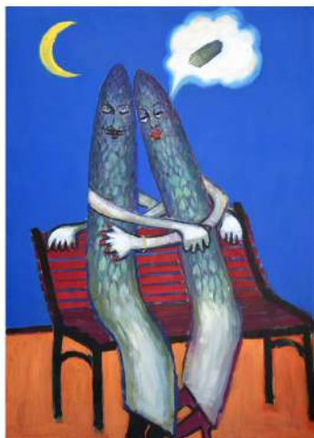
Autore: Franco Negro

CASCINA RUBINA Cascina Rubina, 30 - Poirino 3281840928 Pro. Vendita Str. della Rezza, 3 - Chieri